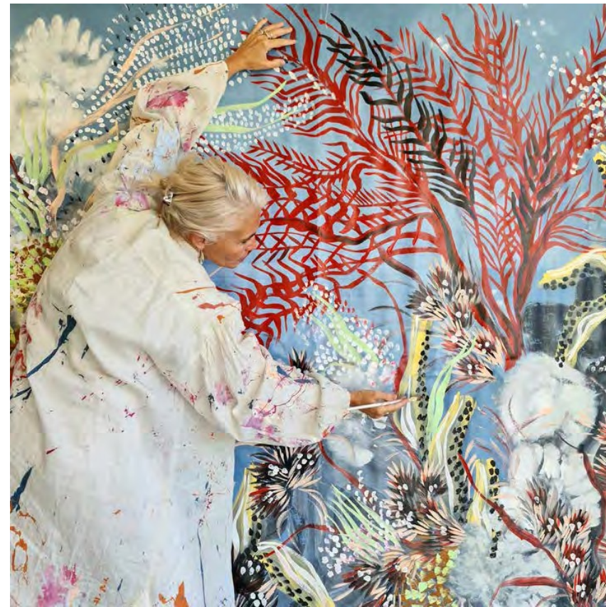
Conferencia Mundial de los Océanos ONU Portugal