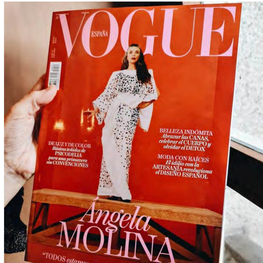
Nota- Vogue España-